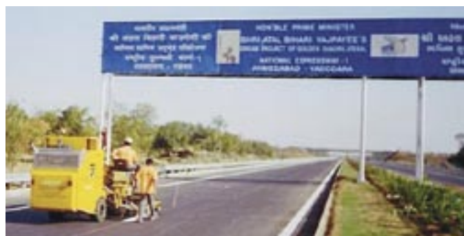
Mark-O-Line Traffic Controls realizando un obra en la India

"Tenemos exigencias muy estrictas con respecto a la productivi-